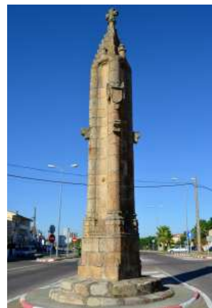
En la foto, el rollo de Trujillo

Se trata de un viaje histórico, artístico, fotográfico, etnográfico, antropológico, literario y sentimental de cuya lectura puede crearse una serie de rutas turísticas de las picotas, que cada viajero puede conformarse a su gusto por cualquiera de las comarcas extremeñas. https://delalunalibros.es/